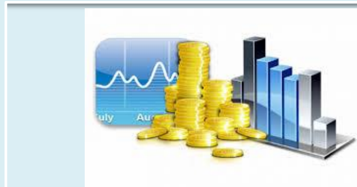
Обсяг капітальних інвестицій на одну особу населення, грн

У 2019 році спостерігається зменшення обсягу капітальних інвестицій в порівнянні з попереднім роком, водночас, зберігається тенденція до зростання інвестицій, починаючи з 2015 року