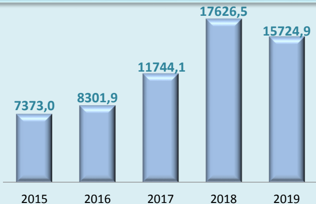
Обсяг капітальних інвестицій, млн.грн

У 2019 році спостерігається зменшення обсягу капітальних інвестицій в порівнянні з попереднім роком, водночас, зберігається тенденція до зростання інвестицій, починаючи з 2015 року